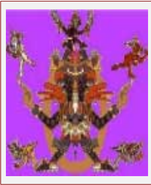
Distinguidos con el Premio Quetzacoatl a la calidad y contenido, otorgado por Pedro Antonio Canseco : .