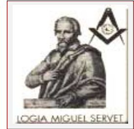
R: .L: . Miguel Servet Nº 46 Or: . de Zaragoza -España-