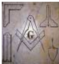
Instrumentos de la simbología masónica relacionada con la construcción

Algunos sitúan a esa organización en 1220, cuando fue creada, en Londres, « The Holy Craft and Fellowship of Masons » [La Santa Arte y Asociación de los Picapedreros], durante el reinado de Enrique III, sobre el cual fueran revisados los estatutos de los picapedreros.