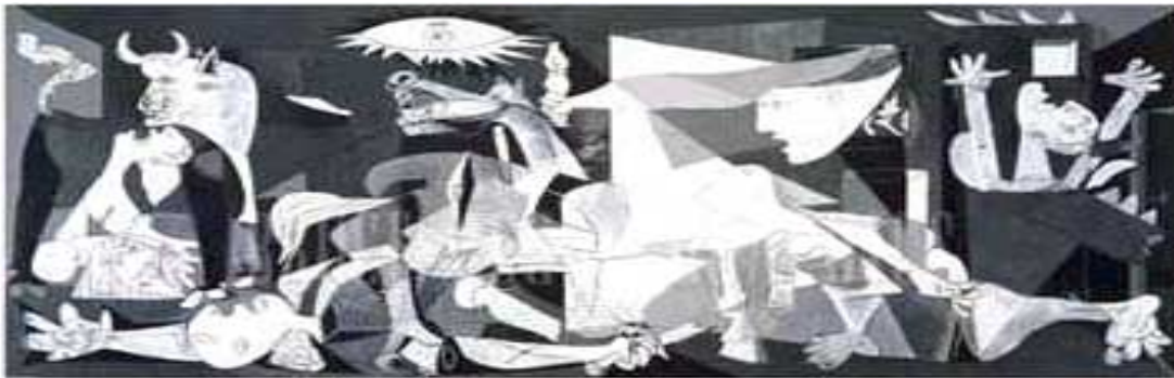
Los desmemoriados; los despistados; los fundamentalistas; los consumistas; los opinantes; los indiferentes, debieran recordar el por qué de este cuadro que pintara Pablo Picasso.

Alcanzable a través de una doctrina aceptable por los masones de todo el mundo.