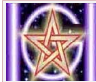
[Humanidad Global] para [Humanitas] y [Humanitas 21]