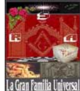
Lista [Mandil] mandil@elistas.net