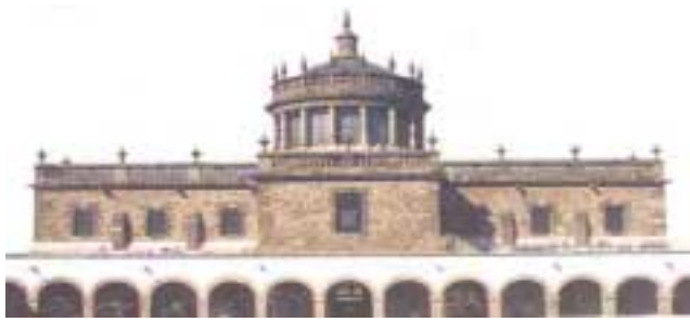
Hospicio Cabañas -Guadalajara - México