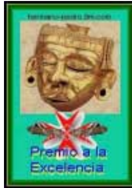
Con el apoyo difusional del Premio «Xipe Totec» del «hermano pedro»