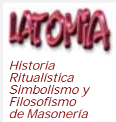
Lista [Latomia] de Valencia -España-